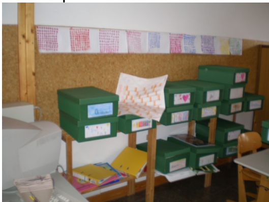
Práce s portfolii v německé škole