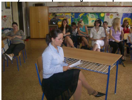
Žákyně z 9.B při obhajobě své práce

Většina žáků byla na obhajobu dobře připravena a po zásluze tak získala titul Doktor Táborské. Rovněž bylo uděleno několik čestných uznání. Nejlepší budou dekorováni na plesu.