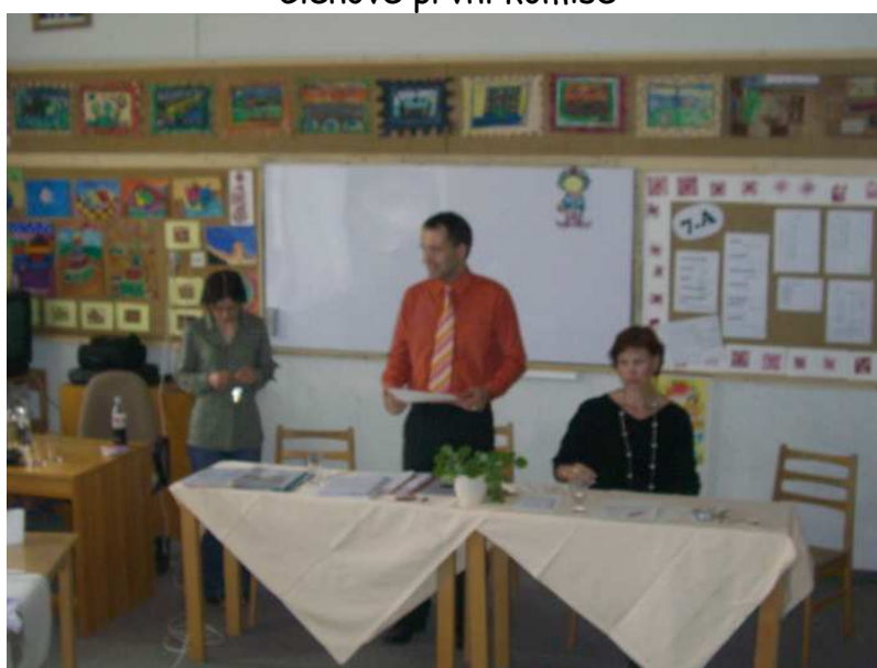
Členové první komise

Většina žáků byla na obhajobu dobře připravena a po zásluze tak získala titul Doktor Táborské. Rovněž bylo uděleno několik čestných uznání. Nejlepší budou dekorováni na plesu.