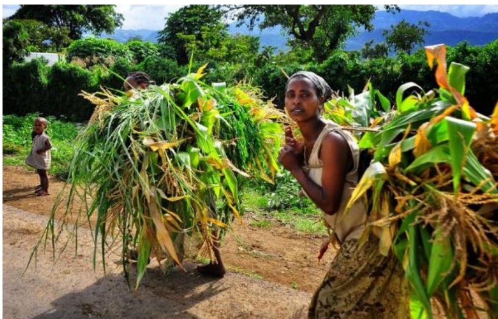
Zemědělství v dnešní Africe