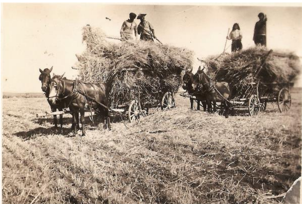
Zemědělství počátkem 20. století v Izraeli

pracovní morálku, výkonnost a sociální poměry.