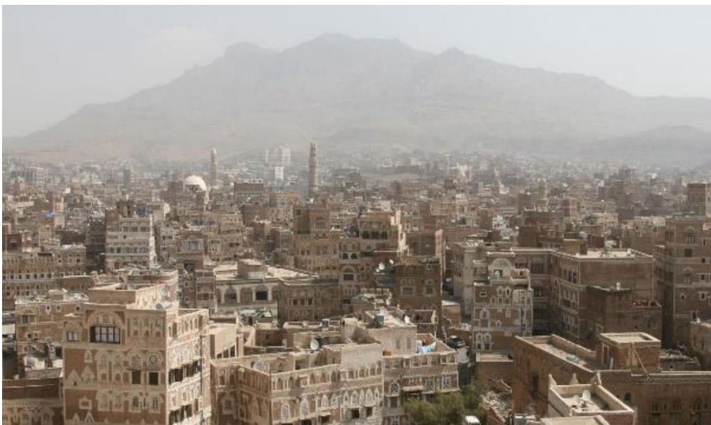
Saná (hlavní město Jemenu)